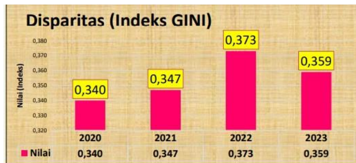
Grafik 1.5 Indeks Gini

Sumber data: Laporan Keterangan Pertanggung Jawaban Bupati Sidoarjo Tahun 2023