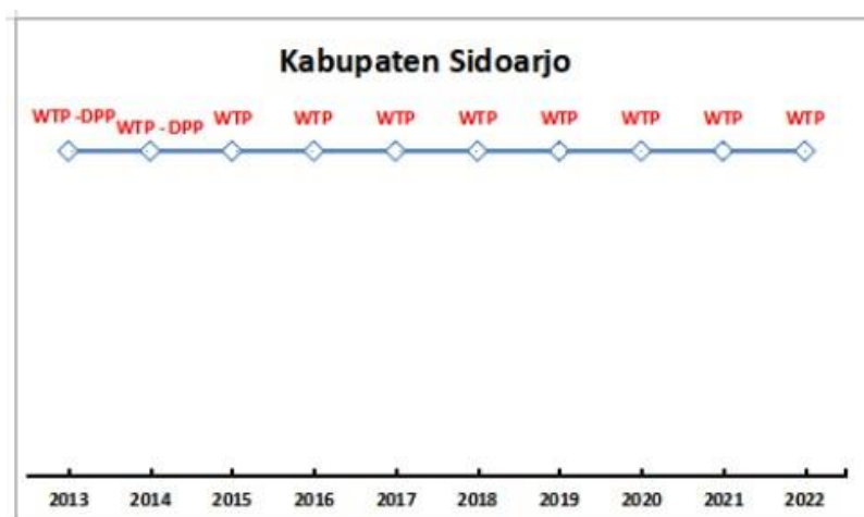
Grafik 3.1 Opini BPK Atas Laporan Keuangan

Sumber Data : Laporan Keterangan Pertanggung Jawaban Bupati Sidoarjo Tahun 2023